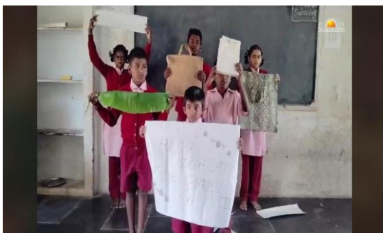
Schüler zeigen Texte zur Plastikvermeidung und Jutetaschen sowie ein Palmblatt, das in Indien traditionell auch in der Verpackung Verwendung findet

Sie erarbeiteten auch exemplarisch, wie Plastikvermeidung praktisch im täglichen Leben erfolgen kann.